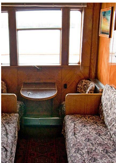
Wnętrze kajuty pierwszej klasy

Przedstawiamy Państwu zestaw informacji praktycznych. Liczymy, że pomogą one prawidłowo przygotować się do udziału w tej wyprawie. Piszemy m.in. o warunkach podróżowania, klimacie, łączności telefonicznej i kursach walut. Prosimy ze szczególną uwagą zapoznać się z punktami dotyczącymi ekwipunku niezbędnego podczas tej wyprawy.