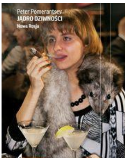
Jądro dziwności. Nowa Rosja

Polecamy kilka książek, które pozwolą przed wyjazdem zagłębić w tematykę Rosji i trochę lepiej rozumieć rzeczywistość, w której będziemy się poruszać: