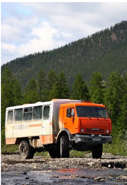
Kamaz - ciężarówka do przewozu osób

Wyprawa na Kamchatkę to okazja by poznać najodleglejsze zakątki Rosji, o własnych siłach zdobyć szczyty aktywnych wulkanów, oraz by po prostu odpocząć na łonie przyrody. Wszystkie trekkingi na trasie będą miały charakter jednodniowych wypadów bez obciążenia. Nie zabraknie też okazji by spróbować lokalnych przysmaków, wykąpać się w gorących źródłach i poznać bliżej kulturę mieszkańców Kamchatki.