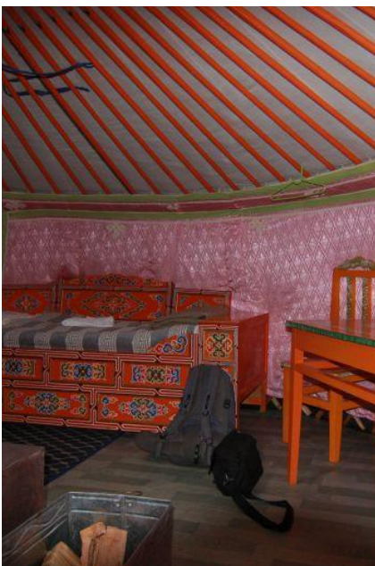
Wnętrze turystycznej jurty

Prosimy ze szczególną uwagą zapoznać się z punktami dotyczącymi ekwipunku niezbędnego podczas tej wyprawy.