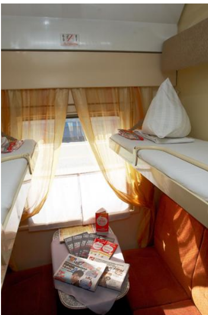
Czteroosobowy przedział w wagonie kupiejskim.

“Bajkał i syberyjska okolica” to wyjazd o bardzo różnorodnym programie, który zapewni bogactwo wrażeń. Na trasie korzystamy z możliwie najlepszych obiektów noclegowych i sprawdzonych środków transportu, ale trafimy w wiele miejsc, do których prowadzą słabe drogi i gdzie nie ma hoteli o europejskim standardzie. Dzięki temu będą mieli Państwo okazję by m.in. przenocować w syberyjskich domach i poznać Syberię od środka.